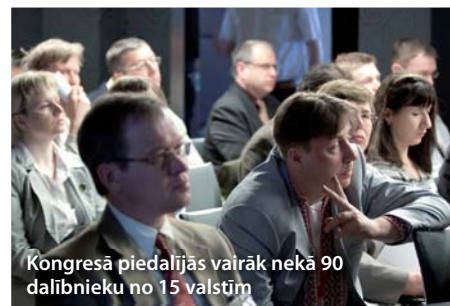
Kongresā piedalījās vairāk nekā 90 dalībnieku no 15 valstīm