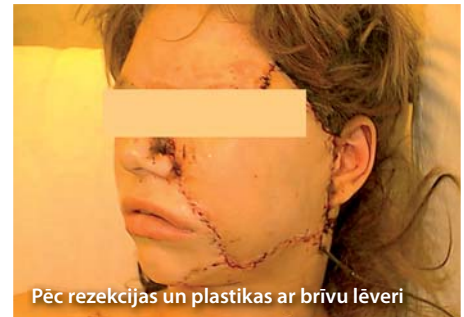
Pēc rezekcijas un plastikas ar brīvu lēveri