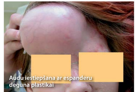
Audu iestiepšana ar esponderu deguna plastikai