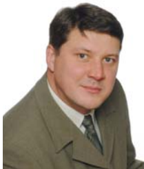
Jānis Krustīns MC valdes priekšsēdētājs Latvijas Rokas ķirurģijas asociācijas prezidents