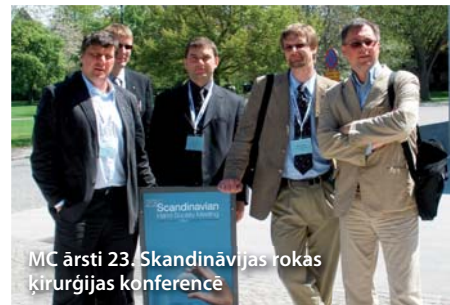
MC ārsti 23. Skandināvijas rokas ķirurģijas konferencē