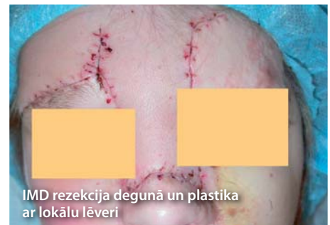
IMD rezekcija degunā un plastika ar lokālu lēveri